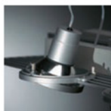
Naklápění s mechanickou aretací nasměrování svítidla