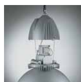
Pojistná ocelová lanka