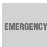
Provedení s nouzovým modulem