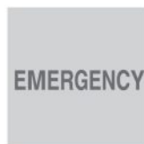
Provedení s nouzovým modulem