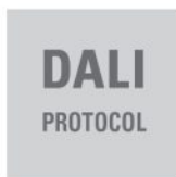
Řídicí systém osvětlení DALI