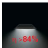
Přímé osvětlení UGR<19 splňuje požadavky ECA, LG7 1500 cd/m 2 65° (2x28/35W)