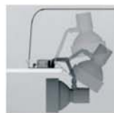
Svítidla lze vyklápat a otáčet kolem svislé osy