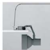
Svítidlo a stavebnicový modul