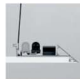
Komponenty svítidel jsou zakryty