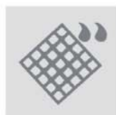
Kompletní ochrana proti prachu a vodě IP 67