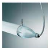
Kabelová průchodka M24