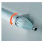
Nastavitelný o 360°