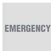
Provedení s nouzovým modulem