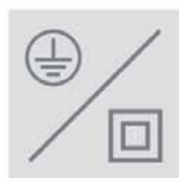
Verze třídy I Verze třídy II