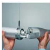
Snadná instalace a údržba