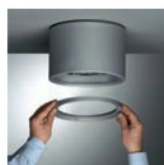
Čistě přístupné rámečku bez použití nástrojů