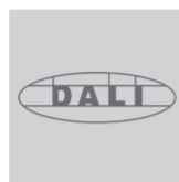
Řídicí systém osvětlení DALI