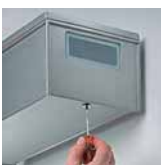
Zařízení pro nastavení světelného svazku ve vodorovném směru