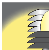
Lamelová clona pro omezení světelného toku do horního poloprostoru