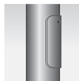
Dvířka s přesahem IP 54