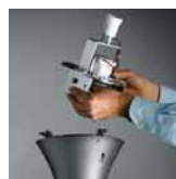
Demontovatelná deska s elektrovýzbrojí