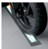
Odolnost statickému zatížení