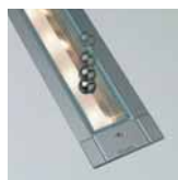
Odolnost dynamickému zatížení