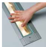
Nízká povrchová teplota