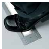
Svítidla se symetrickou optikou mají sklo s protiskluzovou úpravou.